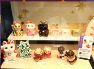
神沼人形 江戸木目込人形 1個¥4,500～12,600 税抜き