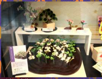
岡半 造花 1個¥5,400～120,000 税抜き