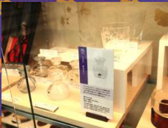
廣田硝子 醤油さし・江戸花切子 1個¥980～22,000 税抜き