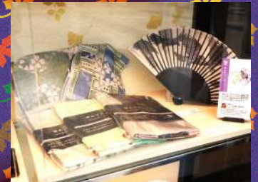
そめもよう 東京友禅 1個¥3,900～10,000 税抜き