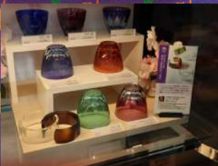
GLASS-LAB 平切子・江戸切子 1個¥15,000～22,000 税抜き