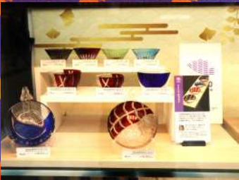
中金硝子総合 寿司切子 1個¥7,000～14,000 税抜き