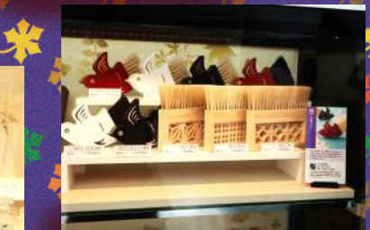
宇野刷毛フラン製作所 フラン 1個¥12,000～16,400 税抜き