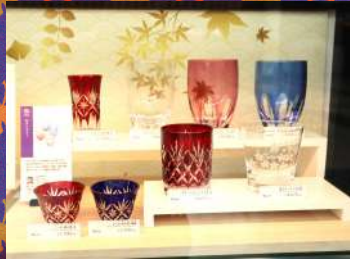
清水硝子 江戸切子 1個¥3,700～15,000 税抜き