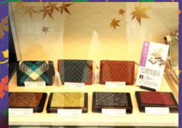
道明 組紐 1個¥27,000 税抜き