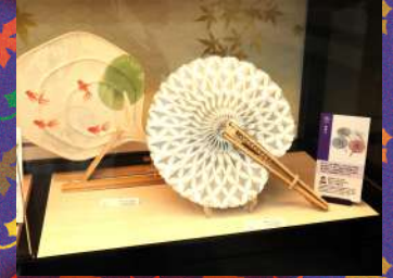
木内藤材工業 藤扇子・うちわ 1個¥5,800～13,600 税抜き