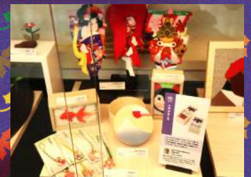
水門商店 江戸押絵羽子板 1個¥500～6,000 税抜き