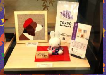
真多呂人形 江戸木目込人形 1セット¥14,000～18,000 税抜き